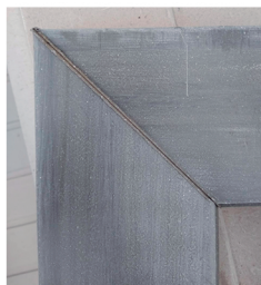
Resultado da solda do produto para portas