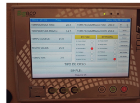
Ciclo de trabalho e controle de temperatura com CLP touch de 7"