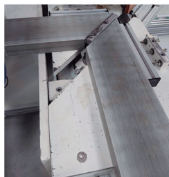
Separador das peças